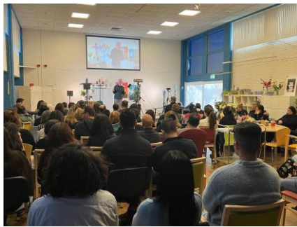
Dienst van tranen en troost