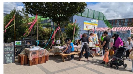
Kikkerpleinfeest 11 juli

De Kikkerfeesten organiseren we samen met partijen uit de buurt en natuurlijk met buurtbewoners om mensen bij elkaar te brengen rondom het Kikkerplein en de bewustwording te vergroten dat het plein van ons allemaal is en dat we er goed aan doen om het plein schoon, heel en veilig te houden. Met andere woorden, het Kikkerplein is de huiskamer van ons allemaal!