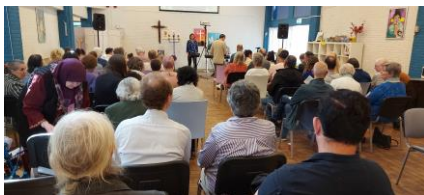
Hemelvaartsdag, Koningsdag op 9 mei

31 maart 13.00 uur De Elzen Clauskindereweg 17