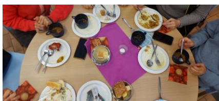
Mensen betrekken, pleisterplaatsen maken