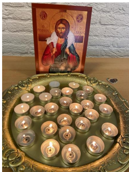
Aan God alle eer!