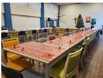
Kerstmaaltijd | Feestdiner