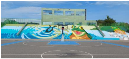
en met het kunstwerk