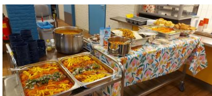
Ook bij een doopdienst hoort lekker en overvloedig eten!