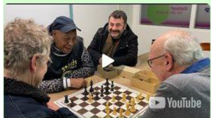
Stadsreporters schaken mee in Osdorp Op vrijdagavond wordt er in Buurthuis 33 (Hart van Osdorp) geschaakt door jong en oud! youtube.com

Een voorbeeld van een kleine, lokale en buurtzame actie is de wekelijkse soepronde die we door de buurt maken. Twee koks en dus twee pannen, twee afwassers, vijf soepkoeriers op de fiets en twee schenkers maken het team compleet dat elke week bijna 60 buurtbewoners van een soepje en een praatje voorziet. Soep, maar vooral aandacht en contact – dat is buurtzaam.