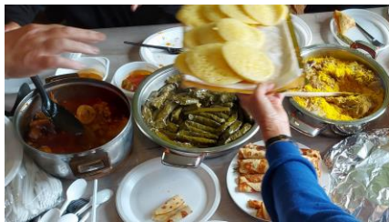
Burendag 28 september

Hart van Osdorp probeert heel lokaal en letterlijk op de hoek van de straat mensen bij elkaar te brengen. En zo komt het dat op de burendag van 28 september kwetsbare mensen in een