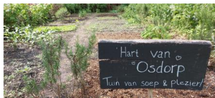
Blik op de tuin van Hart van Osdorp bij de Stadsboerderij.