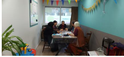
Taalles voor beginners