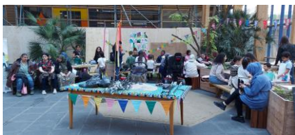
Kikkerfeest 24 mei