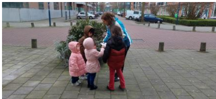
Kikkerfeest 1 maart