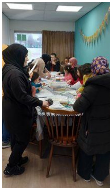
Kikkerfeest 1 maart