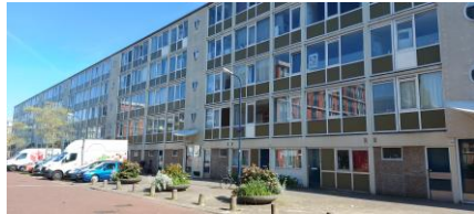
De Nierkerkestraat, waar Buurthuis 33 thuis is

Hart van Osdorp Postadres: Lomondlaan 78, 1060PL Amsterdam Telefoon: 06 1540 2594 Web: www.hartvanosdorp.nl Email: info@hartvanosdorp.nl Giften IBAN: NL09ABNA0507405943 T.n.v. Stichting Hart van Osdorp te Amsterdam