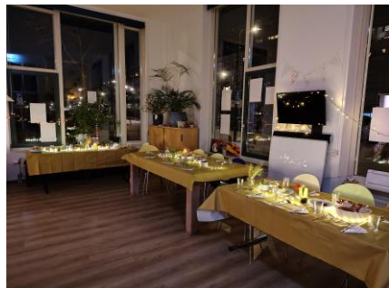
Op 24 december was er in Buurthuis 33 een kerstmaaltijd door een heuse kok

Pinksteren. Dit doen we natuurlijk voor onszelf. Want de christelijke feesten zijn een feest waard! Maar we doen het ook samen met de buurt. Want de christelijke feesten mogen ook in de buurt gevierd worden.