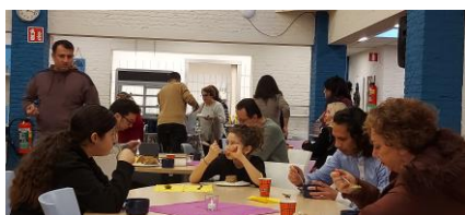
OpZondag (5 januari 2025) met door-gewinterde Hart-van-Osdorpers, jong-gelovigen, zoekers, belangstellenden, nieuwsgierigen en uitgenodigden, wel en niet uit de buurt...