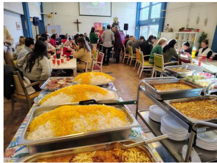
Kerstmaaltijd | Feestdiner in het kerkhuis op 25 december