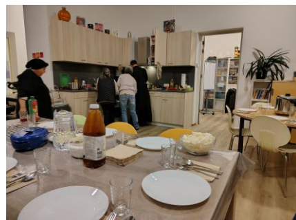
Vorbereidingen voor de buurtmaaltijd op 13 november

vrijwilligers van Buurthuis 33 nog even samen. Zij zijn de ruggegraat van het buurthuis. Zonder vrijwilligers geen buurthuis! Daarom werden ze uitbundig bedankt voor wat zij allemaal doen. Buurthuis 33 doen we samen met elkaar en daar passen dankwoorden bij!