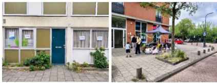
Oud en nieuw buurthuis

Buurthuis 33 is in juni verhuisd van Nierkerkestraat 33 naar Clauskindereweg 21. Gelukkig slechts 250 meter verderop, zodat we in dezelfde buurt blijven en niet in een andere buurt helemaal opnieuw zouden moeten beginnen! Duurzaam buurtwerk is immers honkvast of buurtgebonden.