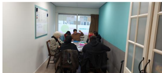
Taalles op 12 februari in het oude pand

Buurthuis 33 geeft geen 'officiële' taallessen met bevoegde docenten. Dan moeten we immers aan allerlei regels en eisen voldoen. Dat is voor ons teveel gedoe. Nee, Buurthuis 33 springt in een enorm gat dat ontstaat door wachtlijsten en doordat er veel mensen zijn die om allerlei redenen niet voor de taallessen van de gemeente in aanmerking komen. Want om in aanmerking te komen, moeten wel al je vinkjes op groen staan en moet je bijvoorbeeld niet, na jaren thuis te hebben gezeten omdat je man je niet uit huis liet, op je zestigste nog taallessen aanvragen. Tsjaja, dan ben je gewoon te laat voor de officiële lessen. Die zijn dan allang afgelopen. Maar de deur van Buurthuis 33 staat altijd open! Wij ondersteunen dus mensen met Nederlands, die anders niet of moeilijk aan de bak komen.