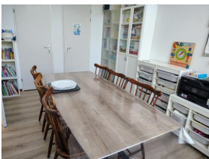
Bijzaaltje voor zes personen