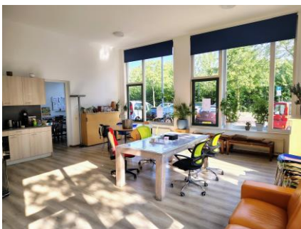
Buurthuis 33 nu, Clauskindereweg 21